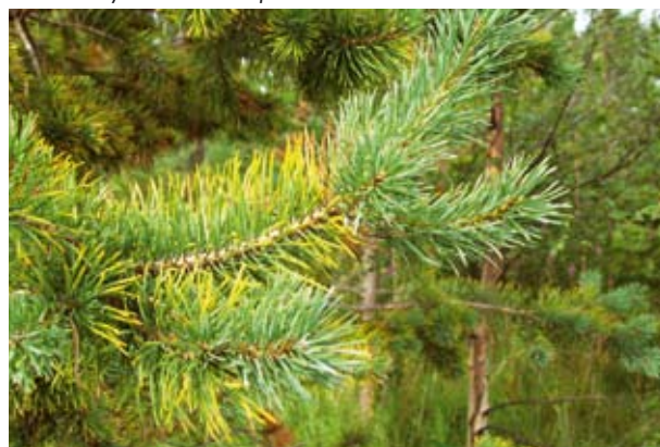
Neulasten väri kertoo puuston ravintetilasta. Tämä mänty kärsii kaliumin puutteesta

Turvetuotannosta vapautuvien suonpohjien ja peltojen metsitys sekä toisaalta peltojen raivaaminen ovat merkittäviä maankäytön muutoksia. Ne vaikuttavat voimakkaasti mm. maan ominaisuuksiin. Kannuksessa tutkitaan suonpohjien käyttömahdollisuuksia energiapuun tuotannossa, pellonmetsitysmenetelmiä ja maankäytön muutosten vaikutusta maan hiilivarastoihin. Hiilitasetutkimuksen tuloksia käytetään mm. kansallisessa kasvihuonekaasuraportoinnissa.