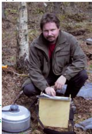
Suopellon maahengitystä mitataan infrapuna-kaasuanalysointilaitteilla

Keski-Pohjanmaalla olemme osa luonnonvara-alan kehittämisverkosto LUOVAa, joka edistää luonnonvara-alan kehittämistä sekä alalla toimivien organisaatioiden yhteistyötä ja verkostoitumista.