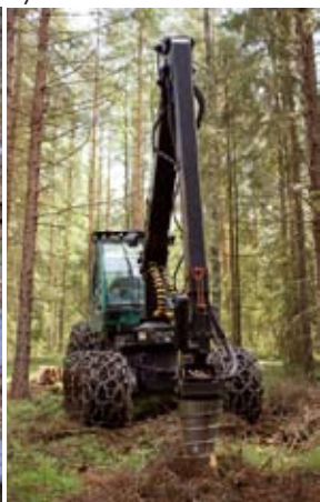
Energiapuuta voitaisiin korjata myös väliharvennuksilla