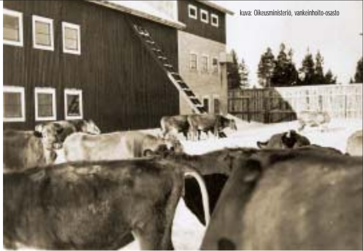
Varavankilan karjaa ja pihattonavetta 1950-luvulla

Suon kuivataminen pelloksi eteni myös nopeasti. Vuoden 1936 talvikuukausina kaivettiin viemäreitä ja kesäaikana oli vuorossa sarkaojitus ja kuokkiminen. Vuonna 1936 pelloksi kuokittiin