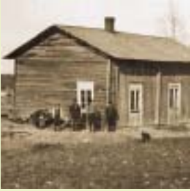
Hirvinsaaren "alkuasukkaat" ennen vankilan tuloa

"Alkkian liepeiden asutus, niin kuin arvata saattaa, on köyhää ja kituvaa. Perheet ovat suuria ja asuvat lahoavissa hökkeleissä. Ne, joilla on uudemmat asumukset, eivät ole kyenneet saamaan asuttavaan kuntoon muuta kuin pirtin, jolle on ominaista puolen tupaa täyttävä avotakka.